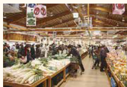
新鮮・安心・安全な糸島市の食材が手に入る直売所

鮮・豊富な地元産品などにより糸島ブランドを確立し、全国の“人”に知ってもらうためのプロモーション活動に力を注ぎました」と2016年度から人口増加に転じた同市の月形祐二市長は語る。