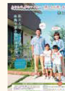
福岡銀行の糸島市限定住宅ローンの紹介

居住する人を対象に、3年間の固定資産税相当額を奨励金として市内店舗で使える商品券で交付。一方で、福岡銀行は、借入金利率を引き下げる専用住宅ローン商品で支援を行う。糸島市の定住促進ガイドブックでは、福岡銀行の糸島市限定住宅ローンを紹介している。