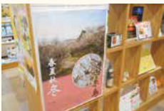
福岡銀行糸島支店に設置されている展示ブース

移住に関する情報発信にも積極的で、2017年10月には、地方企業が東京で情報発信するコワーキングスペースとして福岡銀行が東京駅前の八重洲に開設した「DIAGONAL RUN TOKYO」(ダイアゴナルラン東京)で、移住や観光のための来訪を誘導するイベント「オープン糸島in八重洲」を開催。「見る、聞く、ふれる」を