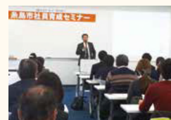
社員育成セミナー

住まいと並んで移住希望者が考えるのは仕事のこと。当然、市としても地元で働いてほしい。そこで、移住希望者と地元雇用のマッチングを図るべく、糸島市企画部および産業振興部の部長と、福岡銀行糸島