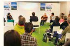
DIAGONAL RUN TOKYOでのイベント風景

ちなみに、福岡銀行は、2015年6月、「糸島市のPRに貢献できれば」との思いから糸島市の中心部にある支店の名称を「前原支店」から「糸島支店」に変更している。