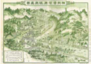
明治時代の湯河原温泉街

古くは万葉集に詠まれ、江戸後期の温泉番付で「東の小結」に位置付けられ、明治以降は多くの作家の創作の場、安らぎの場として愛されてきた湯河原温泉。箱根、熱海の二大温泉地に挟まれ、近年は、じわじわと観光客が減り、ここ10年で日帰り客、宿泊客ともに4割程度減少する厳しい状況にあった。