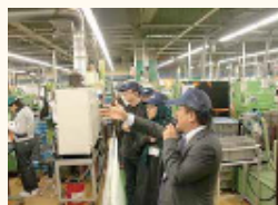
エイベックス㈱における視察の様様

エイベックス社は年間数万個の自動車部品を製造する従業員約380名の企業。同社は競争の激しい業界の中でも効率的な生産ラインと高い品質管理技術で高い評価を受けている。口コミとリピー