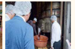
老舗の味噌メーカーの視察の様様