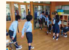
小学校の清掃活動の視察の様様

桑名市に来れば、世界シェア4位のベアリング工場、大型商業施設の最新型バックヤード、清掃や片づけを通じた小学校のしつけ教育、200年続く醸造メーカーなど異なる業種の企業視察が1度に行けると、視察は好評を博した。希望する視察先の数に応じて1日コースや1泊2日コースなどを組成し、市内の飲食店やホテルを積極的に案内したところ、約半年間で市内の消費額は合計1,000万円を超えたという。