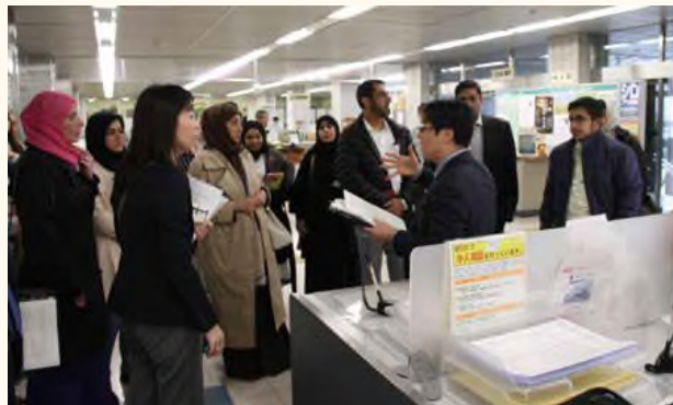
桑名市役所における視察の様様