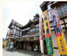
大正5年に創建された芝居小屋「内子産」の外観