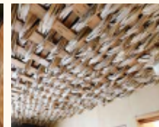
和紙とその原料コゾを使用した天井