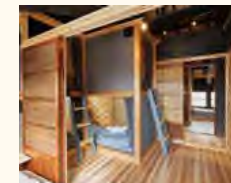
古民家の雰囲気が残る半個室