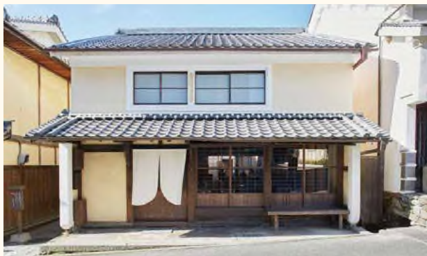
内子町の古民家ゲストハウス&バー「内子晴れ」