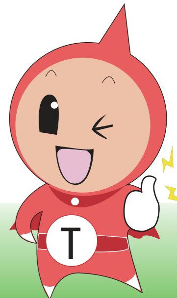
eLTAXイメージキャラクター: エルレンジャー