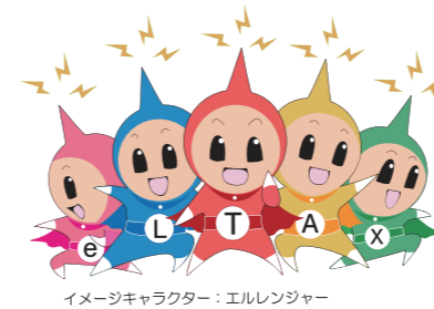
イメージキャラクター：エルレンジャー

納付書に「eLマーク」があれば、 地方税お支払サイトやスマホ決済アプリが利用できます。