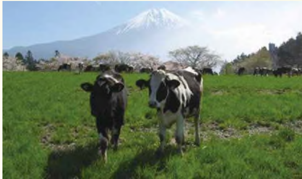
富士宮市内の牧場の風景