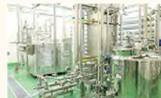
生乳を殺菌・加工する設備

2018年4月、富士宮市と隣の富士市の小中学校77校の給食3万5千食への富士の国乳業「富士山ミルク」の提供がスタートした。近く、病院