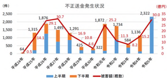
▲ 警察庁、金融庁ホームページより

最近、銀行を騙ったメールやSMSを送りつけ、銀行のインターネットバンキングのログイン画面を精巧に模倣した偽のホームページに誘導し、お客様の情報を不正に盗み取り、預金を不正に送金する事案が多発しています。警察庁や金融庁が本年8月8日に報道発表した注意喚起によると、こうしたフィッシングと呼ばれる手口による不正送金は、今年度上半期における被害件数が過去最多となり、被害額も急増しております。