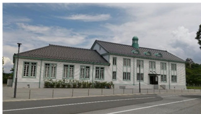
▲ 滋賀大学 彦根キャンパス内の講堂。国の登録有形文化財（建造物）に指定されている。