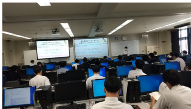
▲ 当日の講座の様子。

当協会は、今後も、地方銀行の各種経営課題ならびに地方銀行の行員のスキル向上などに資する研修を幅広く実施していきます。